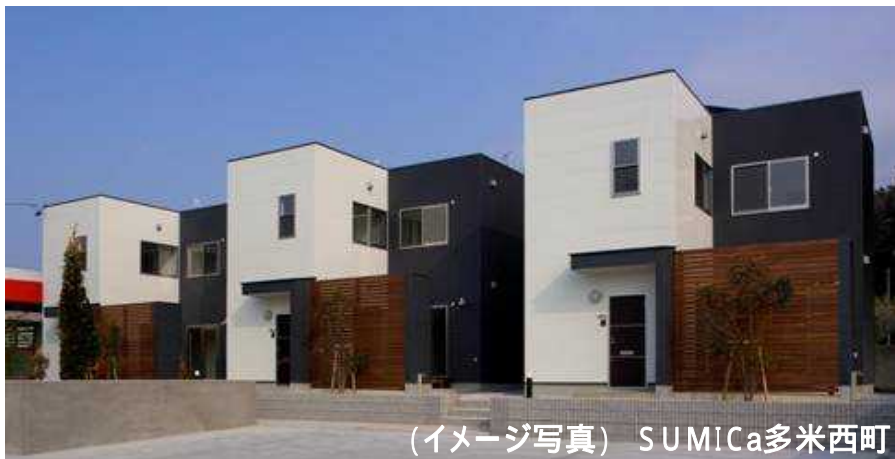
(イメージ写真) SUMICa多米西町