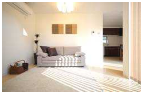
テラスから明るい光が入るリビング