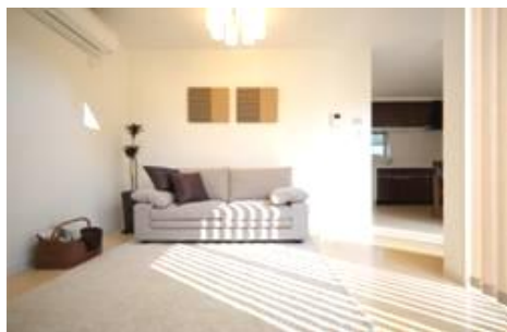
テラスから明るい光が入るリビング

※別途工事:地盤改良、外構工事、屋外付帯設備工事 ※最低販売戸数は2戸からとなります