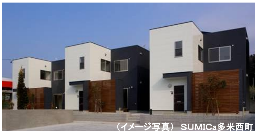
(イメージ写真) SUMICa多米西町