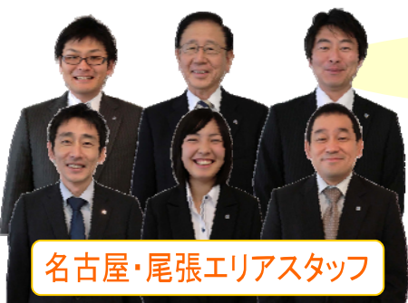
名古屋・尾張エリアスタッフ

〔国土交通大臣登録証明事業 不動産コンサルティング技能登録者(4)第15389号〕