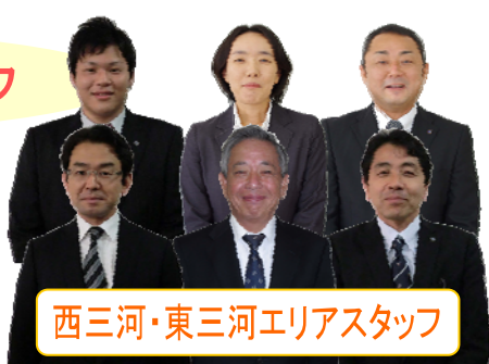
西三河・東三河エリアスタッフ

私たちが皆様のお悩み解決のお手伝いをさせていただきます。お一人で悩まずお気軽にご相談ください。