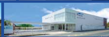
▲医療・介護・高齢者向け施設 建設実績