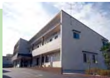
▲サービス付き高齢者向け住宅 建設例【敷地面積1216.34㎡】