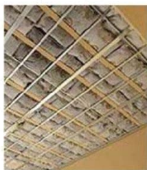
天井用 調湿木炭「炭八」

健康戸建賃貸住宅『炭家』とは調湿・消臭・断熱・防音効果が期待される、健康調湿木炭「炭八」を天井に敷き詰めている戸建賃貸住宅です。オーナー様にも入居者様にも大変ご好評をいただいております、おかげ様で累計220棟を突破しました！見学をご希望の方は、弊社担当者までお問い合わせください。